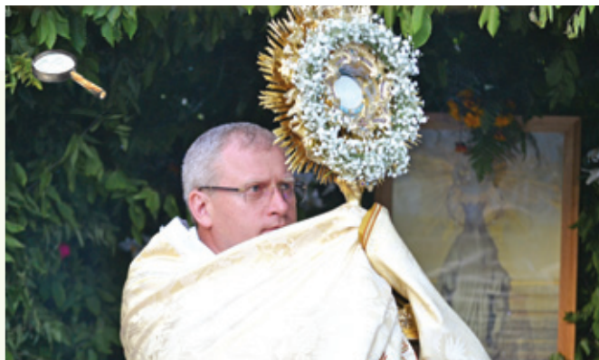
Úrnapi körmeneten Böcskei László váradi püspök

Az Oltáriszentséggel kapcsolatosan gazdag ének- és zeneanyag is született a történelem folyamán. A legelső időkben Dávid király zsoltárait énekelték a szentmisékben, majd igen korán megjelentek a másfajta énekek is.