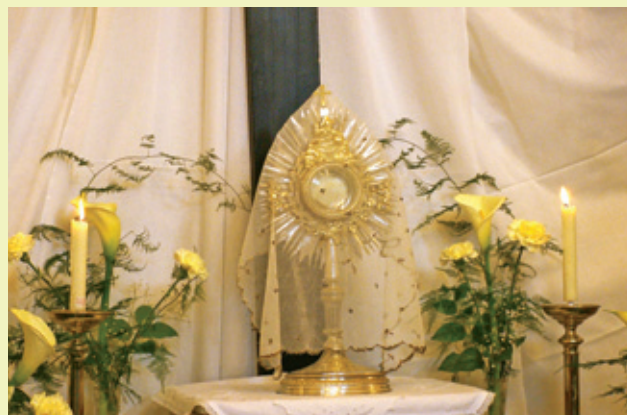
A székelyudvarhelyi Szent Miklós-templom szentsírjánál